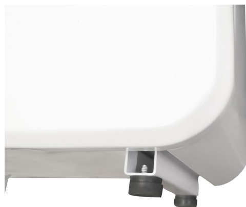
Pieds du climatiseur