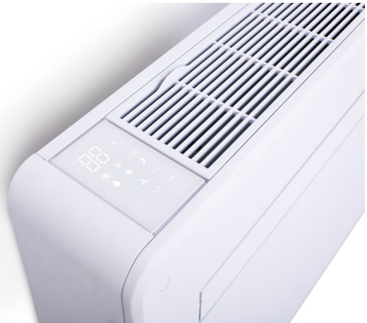
Panneau de commande